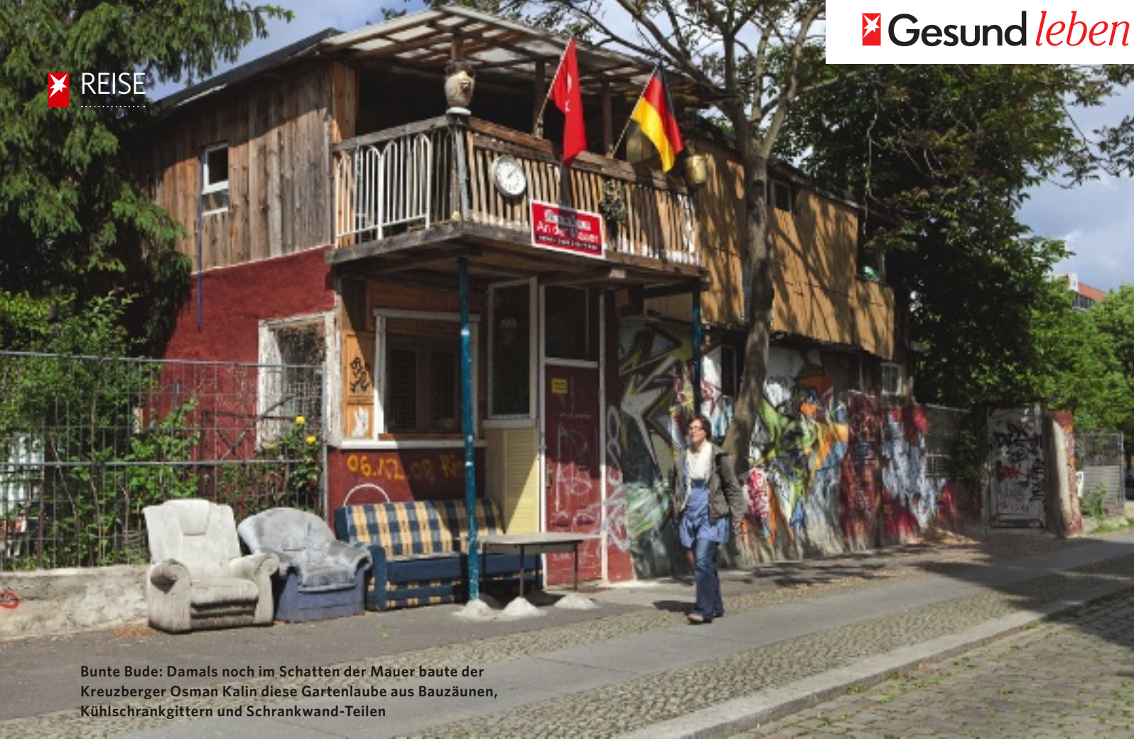
Bunte Bude: Damals noch im Schatten der Mauer baute der Kreuzberger Osman Kalin diese Gartenlaube aus Bauzäunen, Kühlschrankgittern und Schrankwand-Teilen

Statue im Zuge der Neugestaltung rekonstruiert.