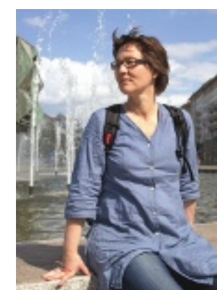
Die Autorin verschnauft auf dem Strausberger Platz in Friedrichshain

VON Ulrike Schimming