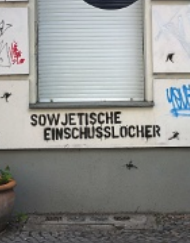
Oben: Unbekannte haben „sowjetische Einschusslöcher“ auf Fassaden an der Dunckerstraße im Prenzlauer Berg gesprüht. Rechts: Wildwuchs und Kunst am Bau in der Cuvrystraße mitten im alten West-Berliner Bezirk Kreuzberg 36